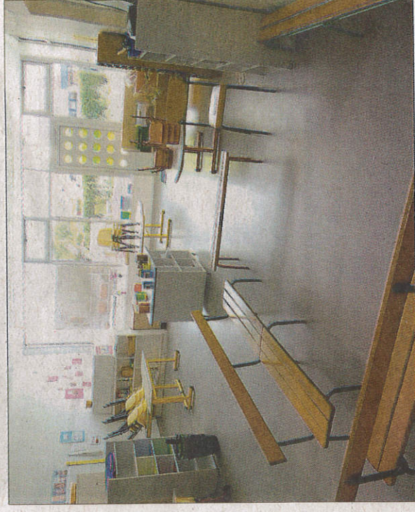
Chaque classe a une couleur dominante différente.

Finalement, les fameux «éléments Prouvé» ont été démontés pièce par pièce par l'entreprise Révi+ fin 2013. Le puzzle géant dort maintenant dans l'enceinte des ateliers municipaux et les signataires de la pétition sont devenus depuis bien silencieux. Après la démolition proprement dite, confiée aux Etablissements Ploquin, les travaux de reconstruction ont débuté en janvier