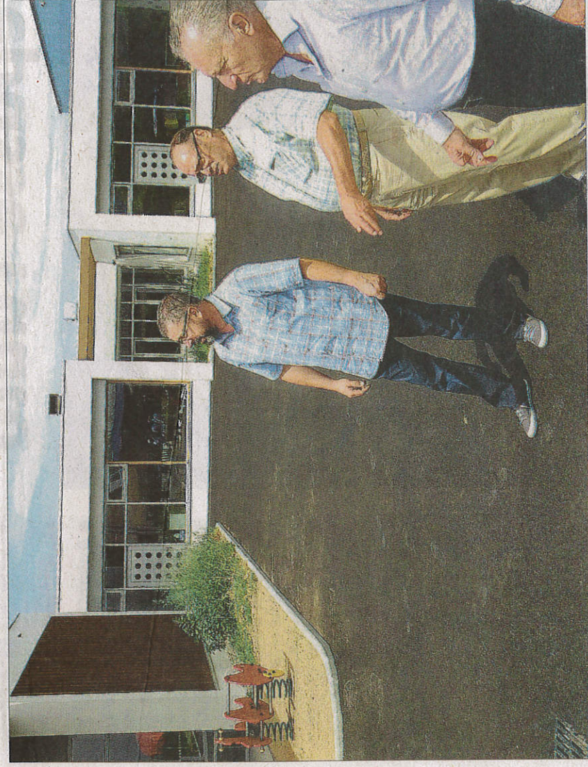
Les travaux sont terminés au groupe scolaire entièrement refait.