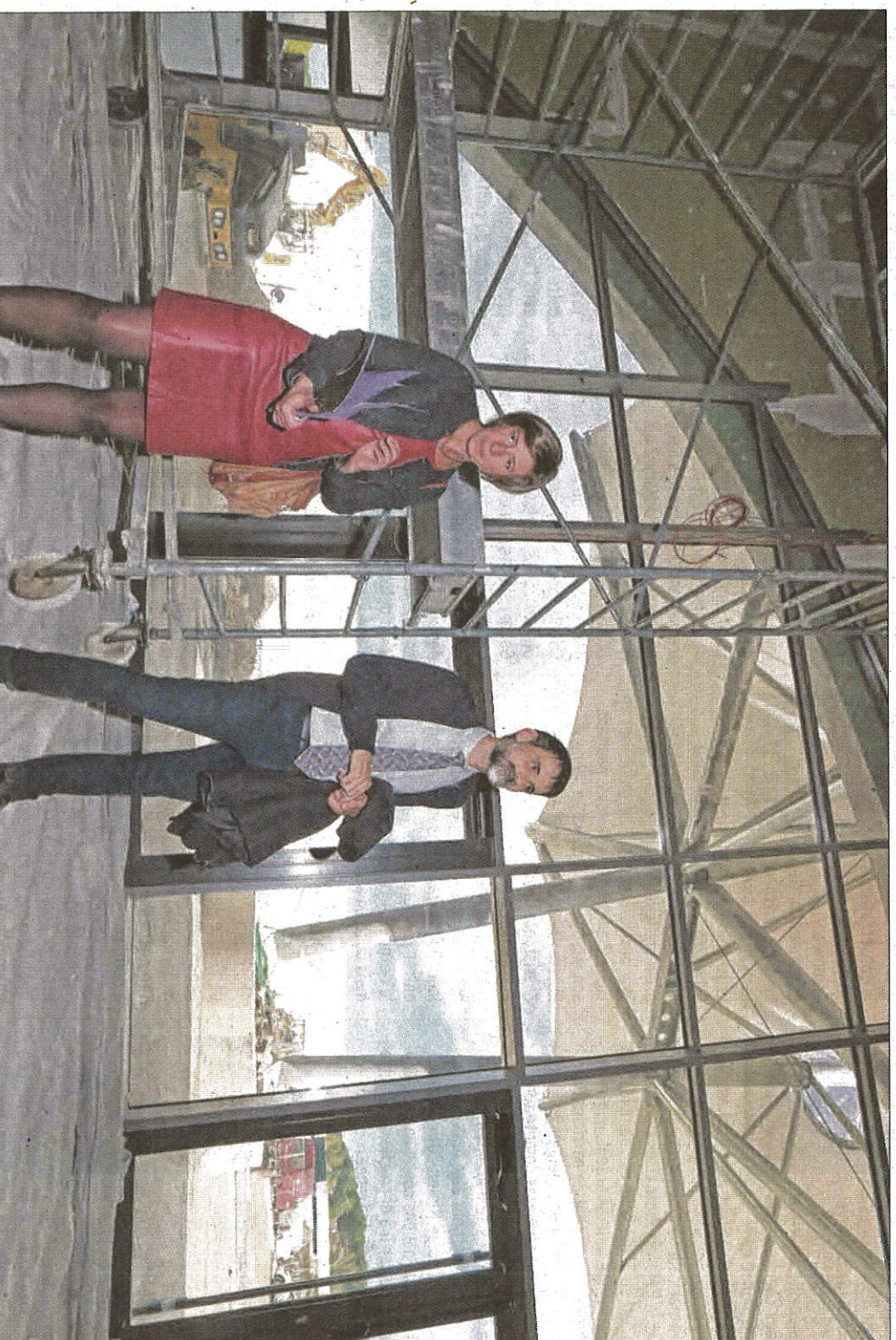
L'architecte Jean-Marc Beffre a réalisé une salle de 800 m 2 qu'une cloison amovible permet de séparer en deux parties de 600 m 2 et 200 m 2 .

On y est accueilli par une grande toile tendue. Cet avant blanc de 300 m 2 , c'est la signature de l'architecte qui souhaitait que le bâtiment soit « signalé de loin ». « Il faut imaginer que d'ici la fin de l'année, l'ancien hypermarché Leclerc sera détruit [Les travaux de déconstruction ont débuté à l'intérieur; ndr].