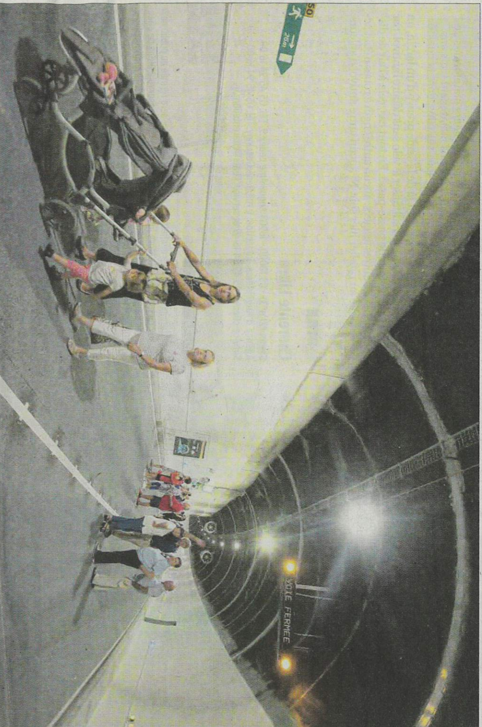
Balade inédite dans le tunnel de la Gâtine pour les officiels et des centaines d'Angoumoisins, hier. A partir de lundi, l'ouvrage rouvre enfin à la circulation.

■ La Ville à fêté hier la fin de 14 mois de travaux au tunnel de la Gâtine ■ L'ouvrage ouvre lundi ■ Fluidifiant ainsi la circulation à Angoulême.